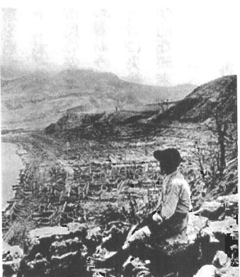
廃墟と化したサン・ピエール (Morne d'Orangeより撮影、Heilprin 1903: 111)

結果として、この政治の論理はまちがっており、正しいのは科学の論理のほうであった。皮肉なことに、まちがいを正す間もなく、ランド教授は死亡した。そして、まちがいを止される間もなく、編集長は死亡した。知事も、その夫人も、みんな死亡した。一九〇二年五月八日木曜日午前七時五十分、ブレイ山は大噴火を起こし、摂氏七百千度のサージが砂速百五十メートルの速さでトキロ離れたサン・ピエールを襲ったのである。町の時計は七時五十二分で止まった。人口約三万人の「西インド諸島のバリ」が